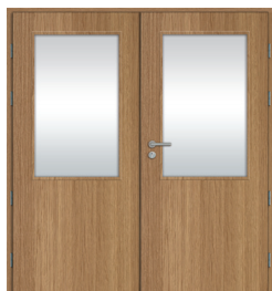
szklone / szklone