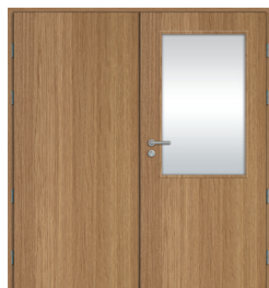
pełne / szklone

ODPORNOŚĆ OGNIOWA EI 60 IZOLACYJNOŚĆ AKUSTYCZNA KLASA D 2 -30, D 2 -25, R w =32dB WYTRZYMAŁOŚĆ MECHANICZNA 3 KLASA DYMOSZCZELNOŚĆ KLASA S 3 ITB-KOT-2018/0407 wyd. 1 KCSWU nr 020-UWB-2695/W