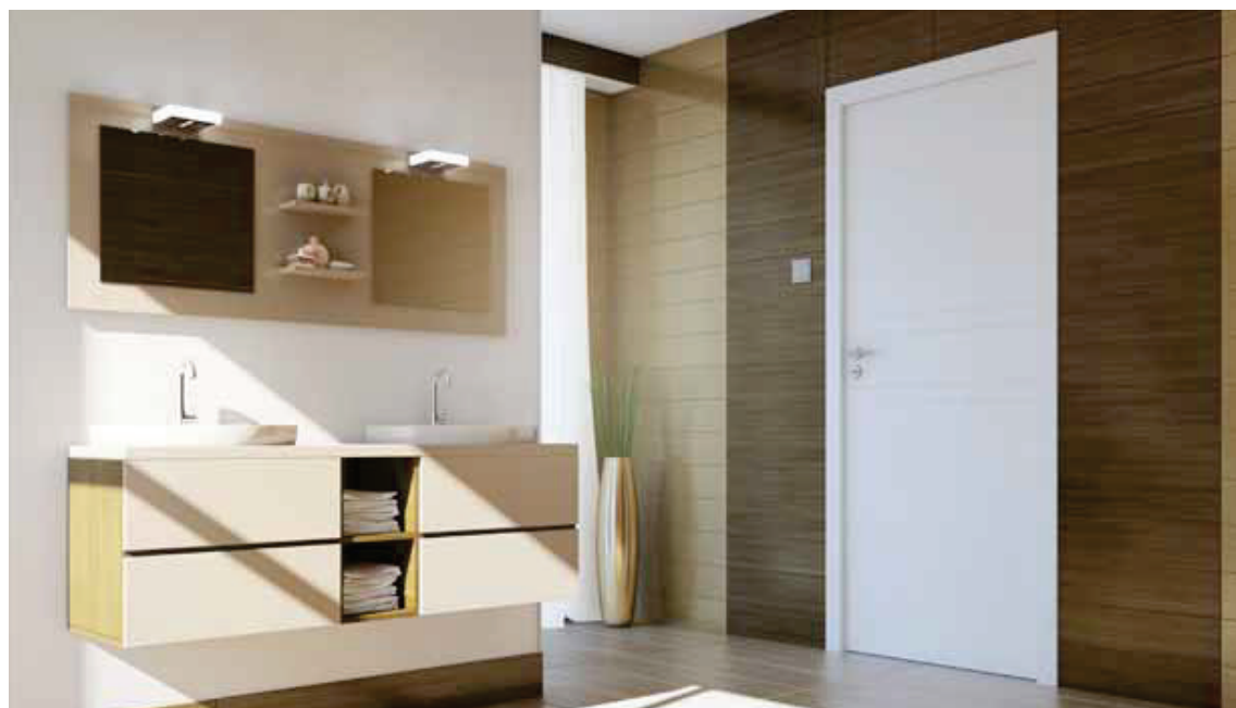
drzwi SUBLIME, wzór B4, ościeżnica regulowana SYSTEM DIN